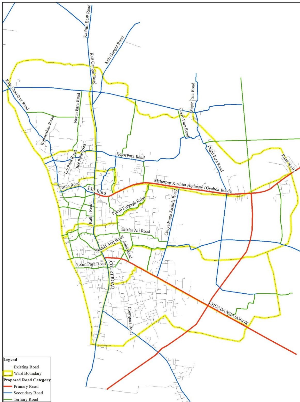
চিত্র: এলজিইডি কর্তৃক প্রস্তাবিত সড়ক সমূহ